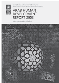
United Nations Development Programme (UNDP): Arab Human Development Report 2003: Building a Knowledge Society. Oxford University Press 2004. 230 Seiten, $ 23.

weiter, die dem ursprünglichen Islam fremd waren. Diese Ideologien sind noch längst nicht überwunden. Eine Auseinandersetzung damit würde helfen, eine vernünftige Einstellung gegenüber Israel zu finden. Dieser Generationsreport leistet dazu jedoch wenig. Im zweiten Fall mag der Leser inzwischen hinreichende Erkenntnisse über das Bagdader Regime erlangt haben, um beurteilen zu können, wer hier die Kinder Iraks einem zynischen Propagandaspiel ausgesetzt und dabei sogar noch einige Vertreter der Vereinten Nationen korrupt hat. Schade, dass solcherlei Rückfälle im Generationsreport vorkommen.