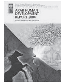
United Nations Development Programme (UNDP): Arab Human Development Report 2004: Towards Freedom in the Arab World. Stanford University Press 2005. 248 Seiten, $ 25,95.

Ferner wird die Frage der Minderheiten in Mittelost gestellt. In einer Fußnote heißt es, der im Freiheitsre-